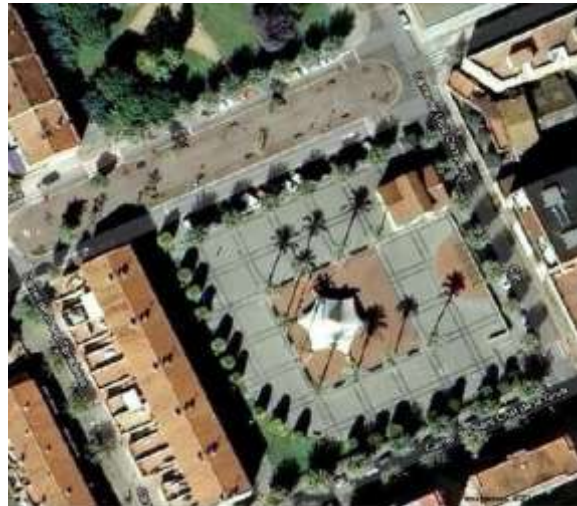
Recinto ferial Plaza de la Quintana (Montmeló - BCN)