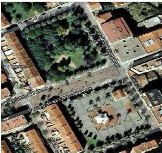
Plaza de la Quintana (2200 m 2 ) y zona ajardinada